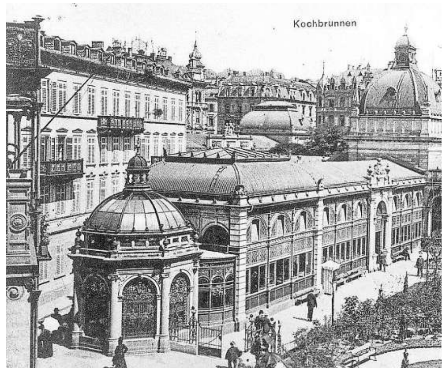
Der Kochbrunnen Ende des 19. Jahrhunderts mit Tempel, Trinkhalle und dem großen Kuppelbau.

Förderverein des Rotary Clubs Wiesbaden-Kochbrunnen e.V. Wiesbadener Volksbank IBAN: DE24 5109 0000 0008 8325 01