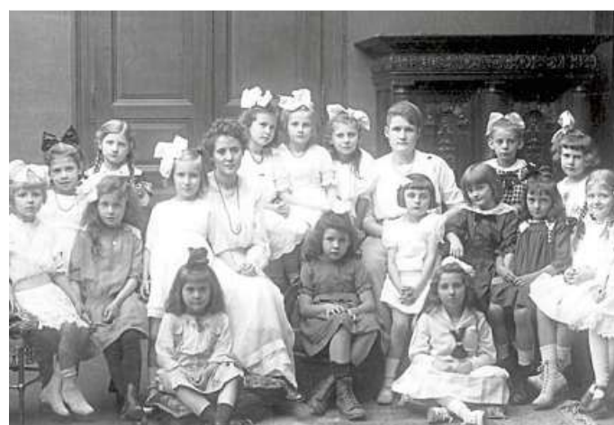
Das Foto zeigt die Klassen 9 und 10 von 1919 der Mädchenschule auf dem Schlossplatz.

► Die Stadtteilhistoriker Wiesbaden sind ein Projekt der Wiesbaden-Stiftung in Kooperation mit der Stiftung Polytechnische Gesellschaft Frankfurt und dem Kulturfonds Rhein-Main. Weitere Informationen im Internet unter www.stadtteilhistorikerwi.de und auf Facebook unter dem Stichwort stadtteilhistoriker-wi .