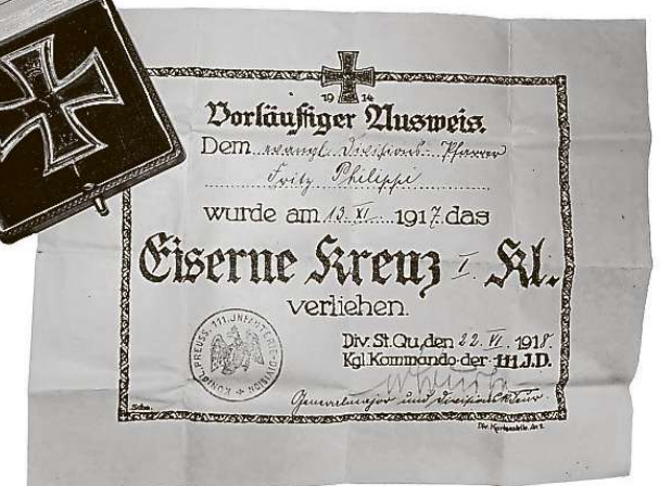
Das Eiserne Kreuz samt Verleihungsurkunde aus dem Archiv der Ev. Ringkirchengemeinde.

Gmelin untersucht die Schriften aber auch unter literarischem Aspekt. Besondere Bedeutung hat das Thema Tod. Der Soldat, der willig sein Leben gibt, um mit seinem Einsatz für das Vaterland zu wirken, relativiert bereits den Wert des Lebens. „Hier verlässt das Thema die historische Dimension in einem Zeitalter, in dem neuvölkische Ideologien wieder erstarken. Im nationalen Egoismus liegt bereits der Keim für die Menschenverachtung, mit der der gegnerische Mensch zum Objekt reduziert wird. Ich wünschte, wir könnten aus dem Schritt Philipphis lernen, den er etwa 1925 getan hat und der ihn andere Motive entdecken ließ als die Liebe zum Vaterland“, so Gmelin, der Philippi als jemanden beschreibt, „der aus Liebe zum Menschen Theologe wurde, dann gläubiger Anhänger der deutschen Nation und der nach einem begeistert begrüßten Krieg sein Leben, Denken und Schreiben neu ordnen musste.“